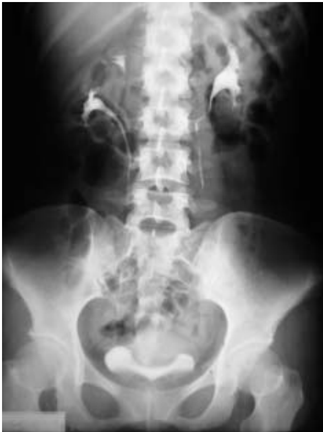
Figura 2. Urografía excretora.

como estudio de imagen inicial ( Figura 2 ) encontrando un doble sistema colector completo derecho corroborado por pielografía ascendente ( Figura 3 ). Además se realizó una uro-angio-resonancia magnética con reconstrucciones en tercera dimensión para valorar la anatomía vascular ( Figura 4 ) de manera preoperatoria y un gammagrama renal que confirmó la hipocaptación del radiofármaco del hemi-riñón superior derecho. Se realiza nefrectomía parcial superior derecha por retroperitoneoscopia, con excelentes resultados cosméticos y funcionales.