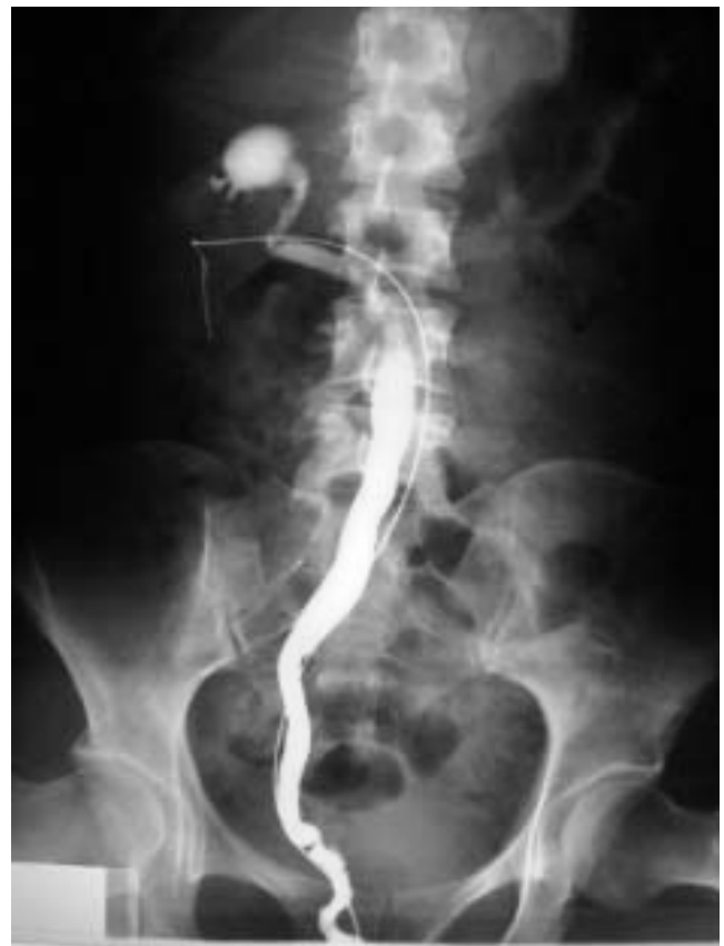
Figura 3. Pielografía ascendente. (guía ureteral metálica en sistema colector inferior).

En un inicio se coloca un catéter ureteral a través del orificio del uréter ectópico y se inicia la irrigación lenta con solución fisiológica convenientemente teñida de azul de metileno. No se coloca sonda transuretral ante el corto tiempo quirúrgico esperado y ante la importante disminución de la uresis una vez iniciado el neumorretroperitoneo.